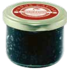
Avruga / Hering-Caviar