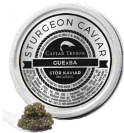
Ossieta Gueldenstaedtii Caviar