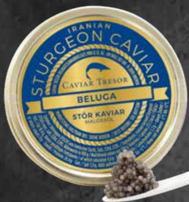
Iranischer Beluga Caviar

Der Beluga Caviar wird aus dem Rogen vom weiblichen Beluga Stör (Huso Huso), dem größten Süßwasserfisch Europas, gewonnen. Mit einem Durchmesser bis zu 3,5 mm weist der Beluga Caviar die größte Körnung auf. Dabei ist der einzigartig milde und sahnige Geschmack charakteristisch für ihn, denn der bekannteste Caviar der Welt zergeht förmlich auf der Zunge. Beluga Caviar ist daher nicht nur selten, er wird unter Gourmets auch als der feinste Caviar der Welt gehandelt. Farblich reicht er von hellgrau bis hin zu anthrazitfarben.