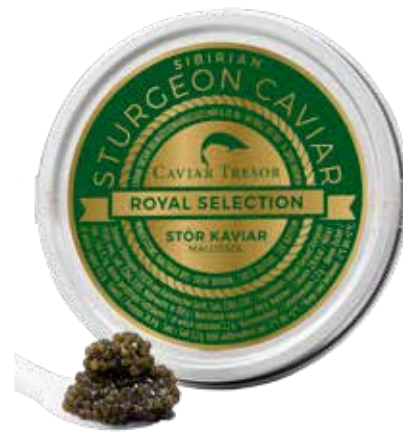
Osetra Imperial Caviar