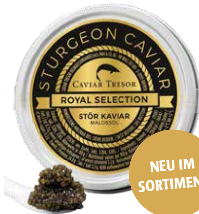
Bulgarischer Osetra Caviar