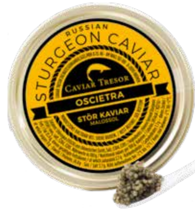
Ossieta Gueldenstaedtii Caviar