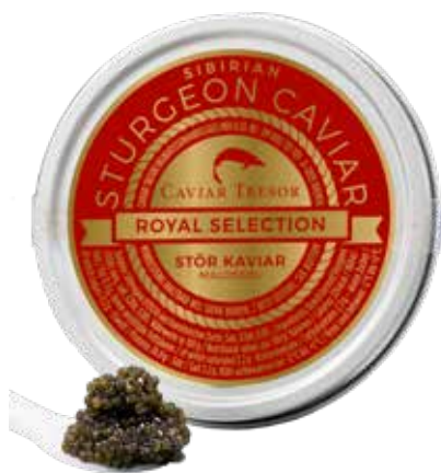
Französischer Osetra Imperial d'Aquitaine Caviar