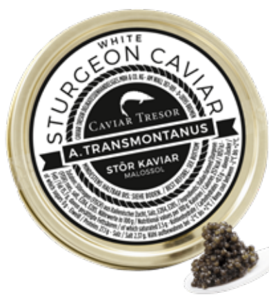
Italienischer Ossieta Caviar